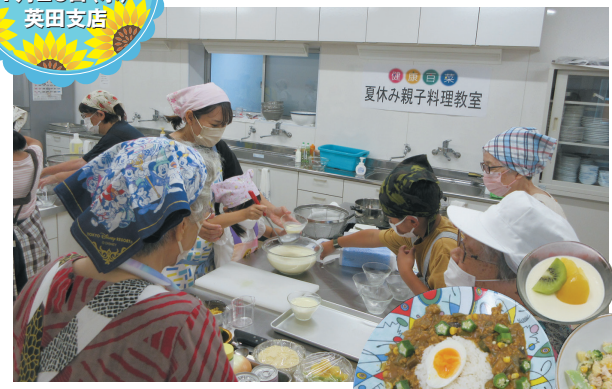
参加者12名のもと、夏野菜カレーと、ブロッコリーとツナのマカロニサラダ、豆乳プリンを作りました。