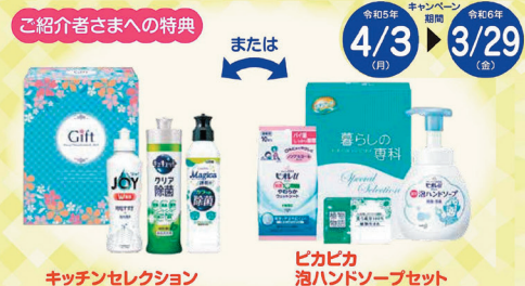
キッチンセレクション ヒカヒカ泡ハンドソープセット

JAで年金お受取中のご家族・お友達をご紹介くださった方、年金お受取のお手続きをされた方にうれしいプレゼント!!