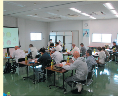
8月30日(水)、盾津支部朝市部会では、参加者12名のもと、新庄支店2階会議室にて、「野菜栽培のポイント(秋冬野菜の栽培方法)」について講習会を開催しました。