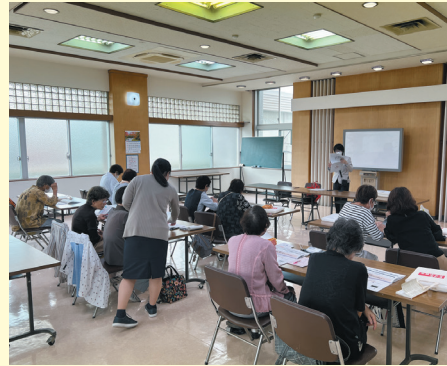
10月4日(水)、女性会縄手支部では、会員・組合員計11名が、縄手支店2階にて、スマホアプリの楽しみ方を学ぶ「JAスマホ教室」に参加しました。