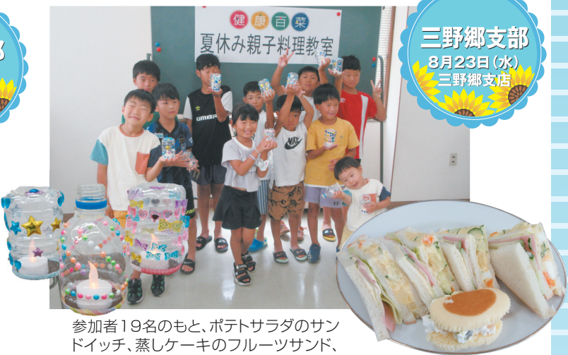
参加者19名のもと、ポテトサラダのサンドイッチ、蒸しケーキのフルーツサンド、ペットボトルを使ったキャンドルライトを作りました。