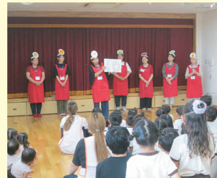
9月7日(木)、女性会意岐部支部役員7名が、うみがめ保育園にて、園児に読み聞かせをしました。