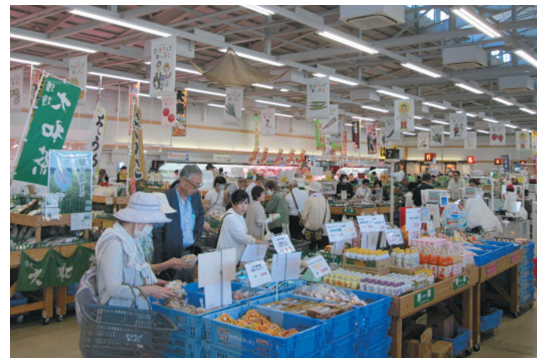
JAならけん直売所「まほろばキッチン」