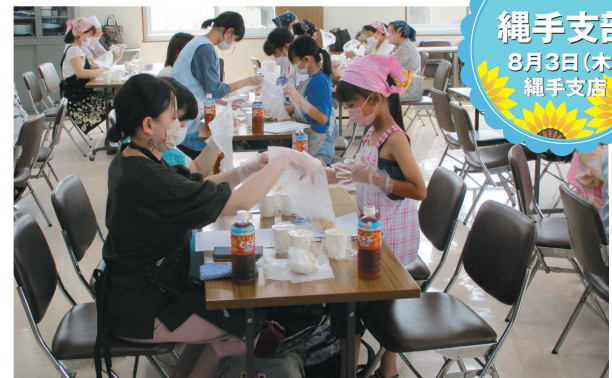
参加者17名のもと、「親子で作る防災食」として、ポリ袋で白ごはんちキンライス、乾物サラダ、麩のわらびもち風デザートを作りました。