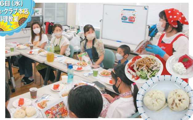
参加者23名のもと、肉まんやパンパンジー、スイカのゼリー寄せを作りました。