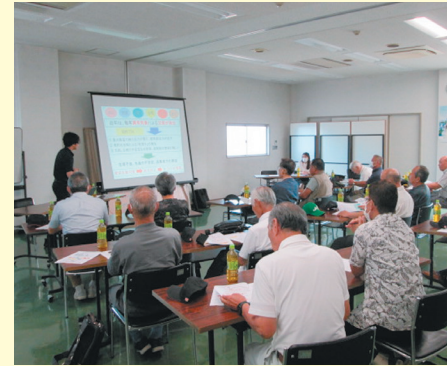
9月7日(木)、盾津支部営農研究会では、参加者19名のもと、新庄支店2階会議室にて、「稲刈り後の機械作業(土づくり)」「農業使用安全講習」について講習会を開催しました。