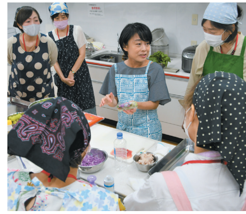
Instagramでチェック！ 生春巻きの実習

9月11日(月)、「第3期女性大学ワタシカレッジ」を開講しました。 「ワタシカレッジ」は、「JAFファンづくり」の一環として、女性を対象に、「食と農」「暮らし」「文化」について、四季を通じて楽しく学んでJAFを身近に感じていただく地域交流の場です。広報誌やLINEなどで募集したところ、定員数を上回る応募があり、抽選の結果、15名が受講されました。