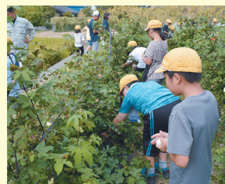
9月28日(木)、意岐部東小学校の4年生16名が、本店アグリゾーンにて、営農渉外の指導のもと、河内木綿の綿摘みをしました。