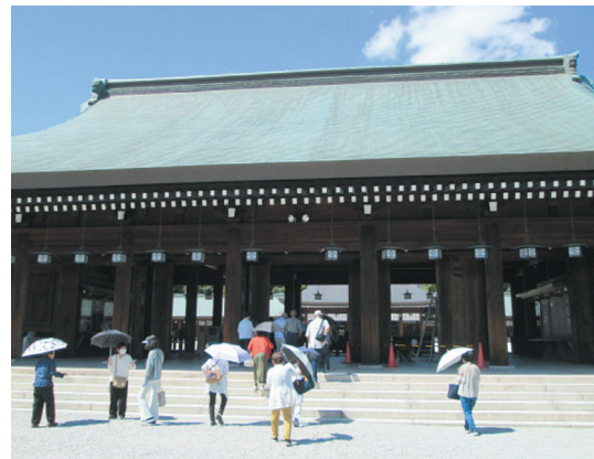
橿原神宮を訪れる参加者

みどりの会 社会見学を楽しむ! グリーン大阪の年金受給者の組織「JAグリーン大阪みどりの会」は、9月12日(火)、13日(水)の2日間、会員276名参加のもと、奈良方面で社会見学を実施しました。 社会見学では、JAならけん直売所「まほろばキッチン」を見学し、「橿原神宮を訪れました。広大な敷地にたたずむ社殿を参拝した後、地元のホテル「エー・ASHIHARA(ザ・カンハラ)」に移動し、和食中心の昼食や抽選会を楽しみました。 みどりの会役員からは「社会見学やゲートボール大会などを通じ、さらなる親睦を深めて参ります。会員の皆さまには、知人・友人の方に、年金受取りのPRやご紹介をよろしくお願ひします」とあいさつがありました。 同会は、会員13,000人を超える組織になり、今後もみどりの会の活性化とJAファンづくりのサポート役として活動します。