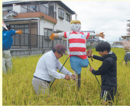
10月4日(水)、英田支部営農研究会では、英田南小学校の5年生が製作した「手作り案山子」を、児童実習田に立てました。