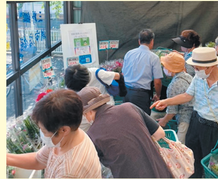
8月9日(水)、10日(木)、三野郷支部朝市会では、三野郷支店朝市店舗にて、「お盆大売出し」を実施しました。