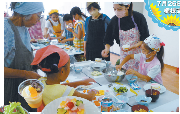
参加者26名のもと、デコレーションご飯、地元野菜のサラダ、オレンジムースを作りました。