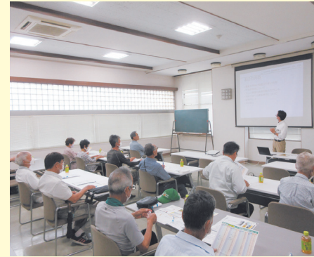
8月30日(水)、三野郷支部朝市会では、参加者12名のもと、三野郷支店にて、「農業講習会」を開催しました。