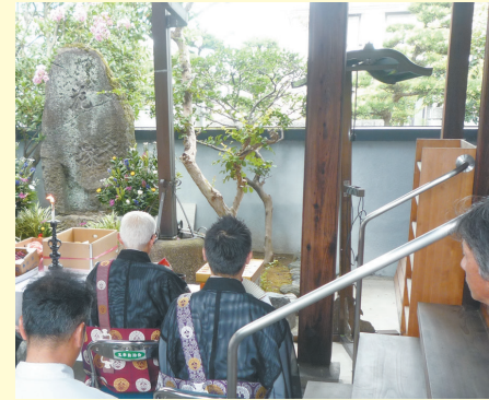
8月18日(金)、玉串花卉生産組合は、玉串元町の極楽寺にて、花供養を行いました。