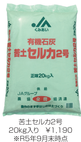
苦土セルカ2号 20kg入り ¥1,190 ※R5年9月末時点

お問い合わせは JAグリーン大阪 営農センターまで フリーコール：0120(2036)4889 ▼9・10月号以前の「4」はホームページにて公開中！ぜひご覧下さい。