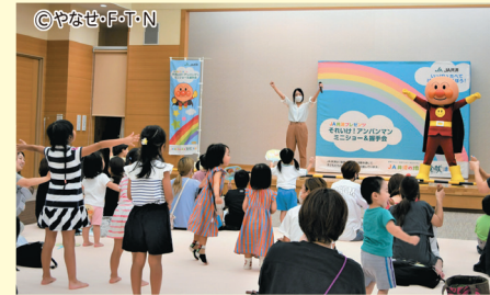
8月29日(火)、グリーン大阪とJA共済連大阪は、本店グリーンホールにて、午前・午後の部を合わせて約120名の参加のもと、「JA共済プレゼンツ それいけ!アンパンマンミニショー&握手会」を開催しました。