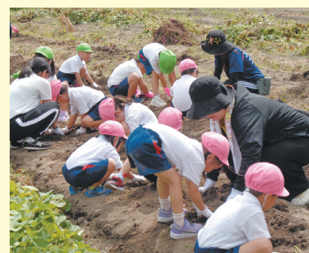
9月28日(木)、若江幼稚園の園児38名が、若江地区の畑にて、若江支部営農研究会の指導のもと、サツマイモ掘りをしました。