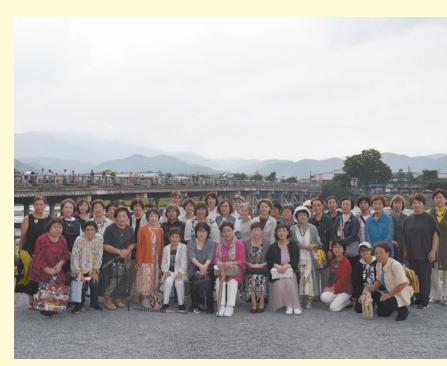
9月20日(水)、女性会盾津支部では、参加者41名のもと、嵐山にて、府外視察を実施しました。