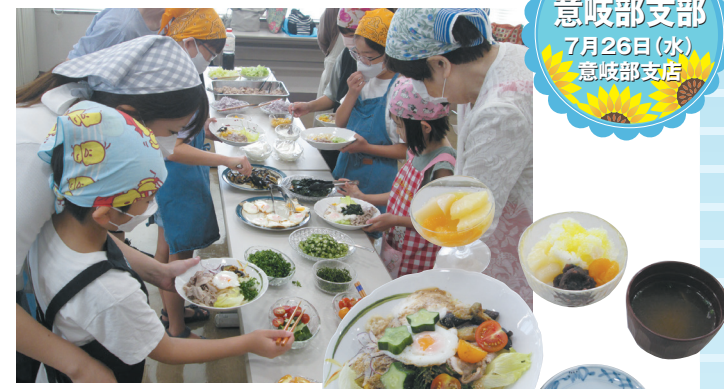
参加者19名のもと、サラダうどん、フルーツゼリー、かき氷、空きビンで作るおにぎり、卵スープを作りました。

夏休み親子料理教室は、子供たちが「食」と「農」の大切さに触れ、関心を高める事を目的としています。参加した子供たちは、女性会会員やおうちの方に教わり、地元の野菜をたっぷり使って作った料理を、おいしそうに食べていました。オカワカメやキュウリ等、子供たちにとって地元野菜を美味しく食べる良い機会となりました。 女性会会員の方々は「子供たち自身が調理することで、食べ物大切さを実感することができたと思います」と話されていました。