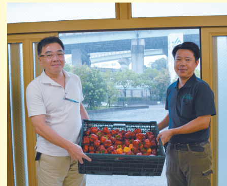
9月11日(月)、グリーン大阪は近畿大学農学部食品栄養学科へ、地元産パプリカ7.5kgを提供しました。これは、同大学奈良病院の病院食に活用されました。